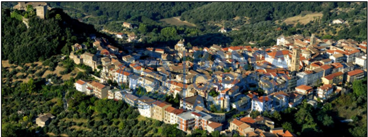
Figura 2: Panorama del Centro Storico di Caiazzo

L'orografia del territorio caiatino, ricco di elementi morfologici e antropici, è caratterizzata dall'alternanza di spazi liberi (luoghi della socializzazione e comunicazione, spazi verdi, ecc.) e di spazi costruiti (edificazione compatta o rada, elementi architettonici puntuali), che danno luogo ad un pregevole sistema ambientale-paesaggistico.