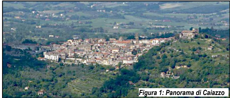
Figura 1: Panorama di Caiazzo

Il Comune di Caiazzo sorge in una posizione che domina la media valle del Volturno, tra 22 e 472 metri s.l.m., occupando un vasto territorio che va dalla Piana Campana alla foce del fiume sul litorale domitico. Il territorio si estende per circa 37 Km 2 e confina con i comuni di Alvignano, Castel Campagnano, Castel di Sasso, Castel Morrone, Liberi, Limatola, Piana di Monte Verna, Ruviano.