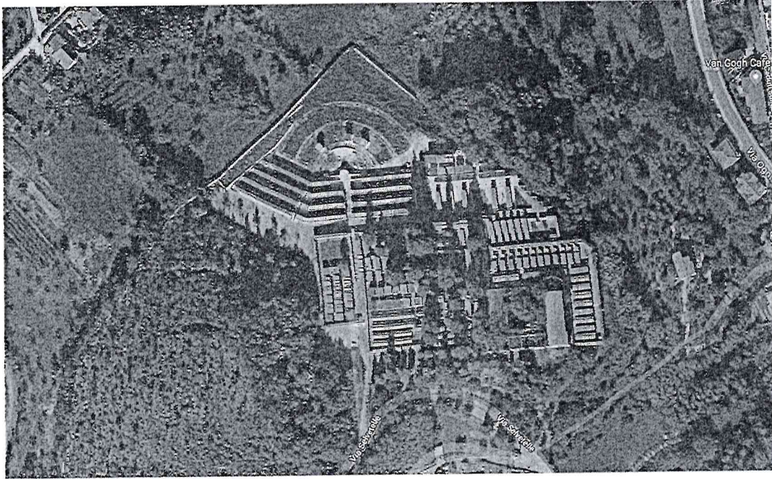
Figura 4: ortofoto dell'area del cimitero (ampliamento e vecchio cimitero)